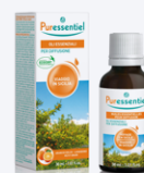
1 MISCELA A SCELTA OLI ESSENZIALI PER DIFFUSIONE 30 ml