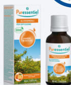
MISCELA VIAGGIO IN SICILIA OLI ESSENZIALI PER DIFFUSIONE 30 ml