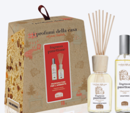
FRAGRANZA PANETTONE SET PROFUMATORI AMBIENTE