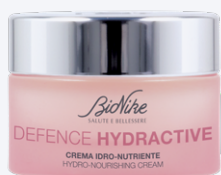
DEFENCE HYDRACTIVE CREMA IDRO-NUTRIENTE 50 ml