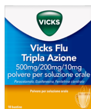
VICKS FLU TRIPLA AZIONE 500 mg/200 mg/10 mg 10 bustine