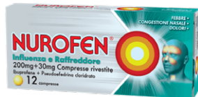
NUROFEN INFLUENZA E RAFFREDDORE 200 mg+30 mg 12 compresse