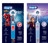
ORAL-B VITALITY PRO KIDS 3+ SPAZZOLINO ELETTRICO • Spiderman • Frozen

**CASHBACK ORAL-B PHARMA" valida dal 01/07 al 31/12/25 in farmacia/parafarmacia/sanitaria. Conserva lo scontrino e chiedi il rimborso entro 15 gg previa registrazione/accesso a P&G Per Te. Prodotti coinvolti, combinazioni di acquisto e Termini e condizioni su www.cashbackoralb.pgperite.it