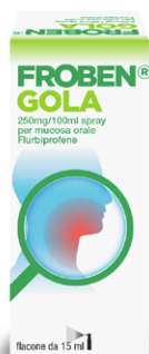
FROBEN GOLA 250 mg/100 ml SPRAY Flacone da 15 ml