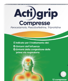
ACTIGRIP 2,5+60+500 mg 12 compresse