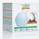
DIFFUSORE UMIDIFICATORE API