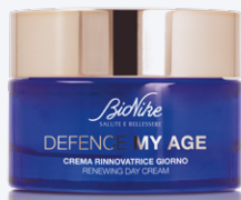
DEFENCE MY AGE CREMA RINNOVATRICE GIORNO 50 ml