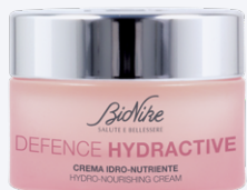
DEFENCE HYDRACTIVE CREMA IDRO-NUTRIENTE 50 ml