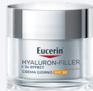
HYALURON-FILLER + 3X EFFECT CREMA GIORNO SPF30 50 ml