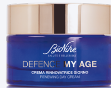
DEFENCE MY AGE CREMA RINNOVATRICE GIORNO 50 ml