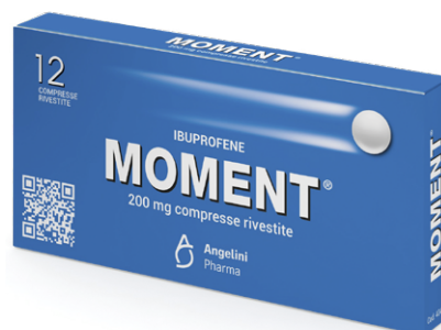
MOMENT 200 mg 12 compresse rivestite