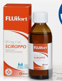
FLUIFORT 90 mg / ml SCIROPPO Flacone da 200 ml