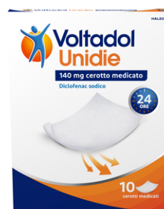
VOLTADOL UNIDIE 140 mg 10 cerotti medicati