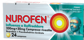
NUROFEN INFLUENZA E RAFFREDDORE 200 mg+30 mg 24 compresse