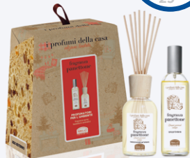
FRAGRANZA PANETTONE SET PROFUMATORI AMBIENTE