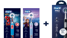
1 ORAL-B VITALITY PRO KIDS 3+ SPAZZOLINO ELETTRICO • Spiderman • Frozen + ORAL-B PRO SERIES 1 SPAZZOLINO ELETTRICO