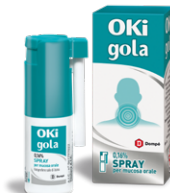
OKI GOLA 0,16% SPRAY 15 ml