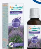
MISCELA PROVENCE OLI ESSENZIALI PER DIFFUSIONE 30 ml