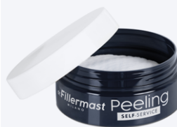
DR. FILLERMAST PEELING Self-service 45 ml 30 pad