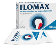
FLOMAX 350 mg GRANULATO 20 bustine