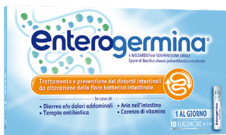
ENTEROGERMINA 4 MILIARDI/5 ml SOSPENSIONE ORALE 10 flaconcini

CONTINUA LA PROMOZIONE DI NOVEMBRE VALIDA FINO AL 31 DICEMBRE 2025