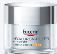
HYALURON-FILLER + 3X EFFECT CREMA GIORNO SPF30 50 ml