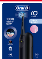
ORAL-B iO SERIES 2 SPAZZOLINO ELETTRICO Night Black + Travel Case