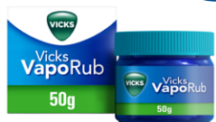
VICKS VAPORUB 50 g