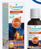
MISCELA COCOONING OLI ESSENZIALI PER DIFFUSIONE 30 ml