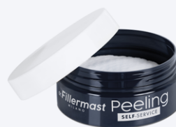
DR. FILLERMAST PEELING Self-service 45 ml 30 pad