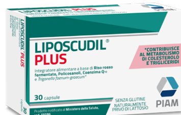
LIPOSCUDIL PLUS 30 capsule