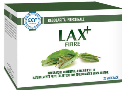
LAX+ FIBRE 20 stick pack