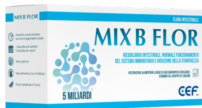
MIX B FLOR 12 flaconcini