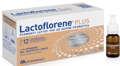
LACTOFLORENE PLUS 12 flaconcini