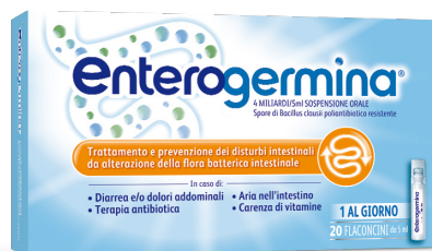
ENTEROGERMINA 4 MILIARDI/5 ml SOSPENSIONE ORALE 20 flaconcini da 5 ml