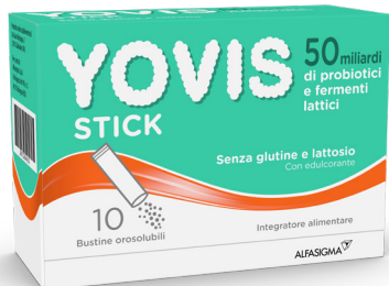
YOVIS • Stick 10 bustine orosolubili • Caps 10 capsule da 0,7 g