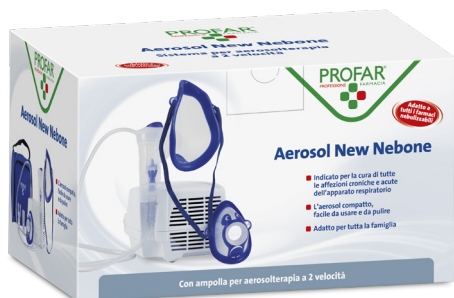
AEROSOL NEW NEBONE